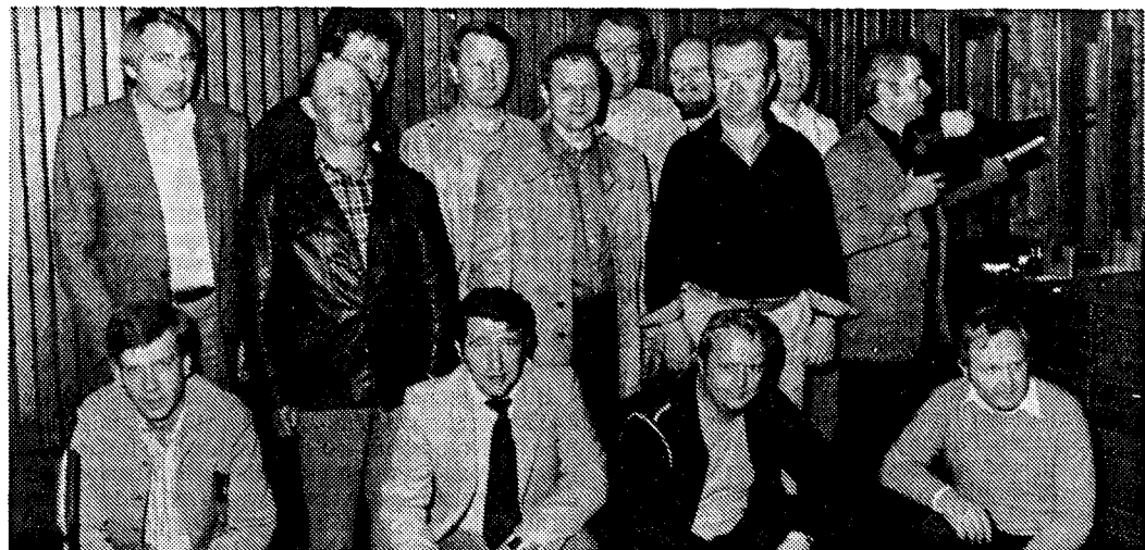
Der Schützenverein „Ruhe siegt“ Cammer konnte vorzeitig die Schießsportanlage im neuen Dorfgemeinschaftshaus in Cammer in Betrieb nehmen. 1.

Petershagen-Döhren. Unbekannte Täter verübten in der Nacht zum Sonntag in Döhren einen Einbruch in eine Gaststätte an der Döhrener Straße. Aus den Regalen ließen die Täter etliche Päckchen Tabak verschiedener Marken mitgehen. Von den Tätern wurden Automaten aufgebrochen und Bargeld daraus gestohlen. Außerdem ließen sie eine etwa 40 Jahre alte „National“-Star-Gitarre mitgehen.